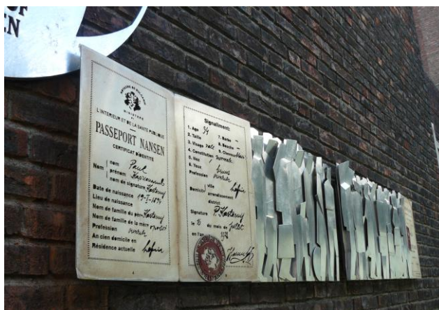
Le mémorial de F. Nansen et du passeport Nansen à Oslo (Norvège) [il se situe sur le côté de l'hôtel de ville, le Radhuset] © cliché JF Pellan – juin 2011